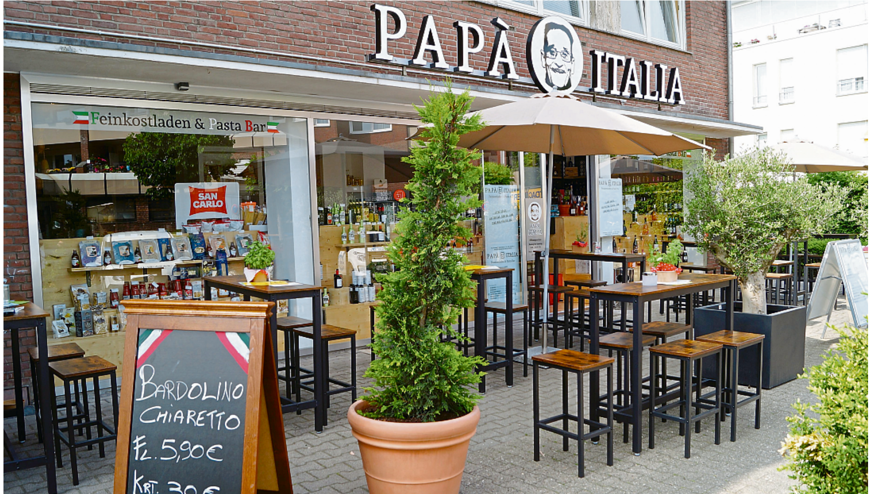
Gemütlich verweilen kann man bei gutem Wetter wie derzeit im Außenbereich des Papa Italia. Hier stehen rund 30 Sitzplätze zur Verfügung. Bei schlechtem Wetter findet man auch im Inneren ein gemütliches Plätzchen.