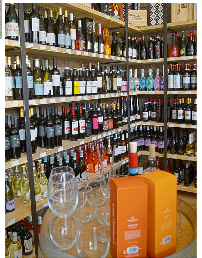
Der Liebhaber leckerer Tröpfchen kann im Papa Italia aus zahlreichen italienischen Weinen wählen.