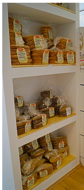
Typische italienische Backwaren gewünscht? Selbstverständlich findet man sie man im Papa Italia.

Geöffnet hat der „Feinkostladen & Pasta Bar Papa Italia“ von montags bis samstags zwischen 9 und 20 Uhr. Die warme Küche öffnet täglich um 12 Uhr, so dass der Betrieb am Rüschausweg 7 in Münster auch eine gute Anlaufstelle für die Mittagspause ist.