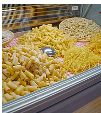
Das Angebot an frischer Pasta kann sich sehen lassen.