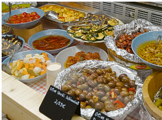
Das macht Lust aufs Essen: die Antipasti.