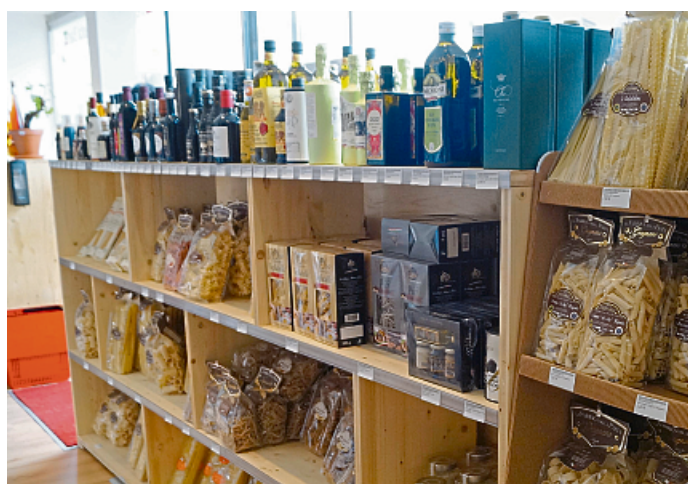
Auch in Sachen italienischer Ölsorten und Nudeln ist der Feinkostladen in Münster-Gievenbeck bestens sortiert.