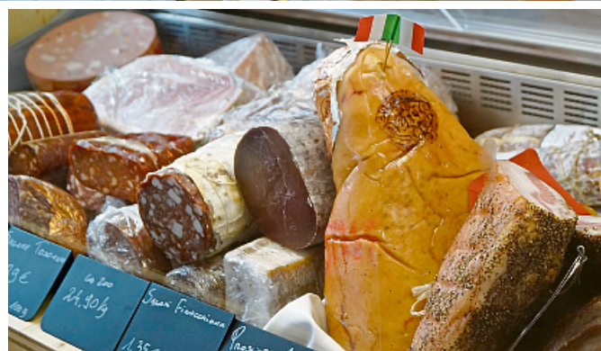
Typisch italienische Wurst- und Schinkenspezialitäten bekommt man im Papa Italia natürlich auch.

In Sachen Antipasti stehen entweder die „Formaggio misti“ (gemischte Käseplatte) „Affettato misto“ (Aufschnittplatte) oder „Antipasti misti“ (gemischte Vorspeisen) zur Wahl.