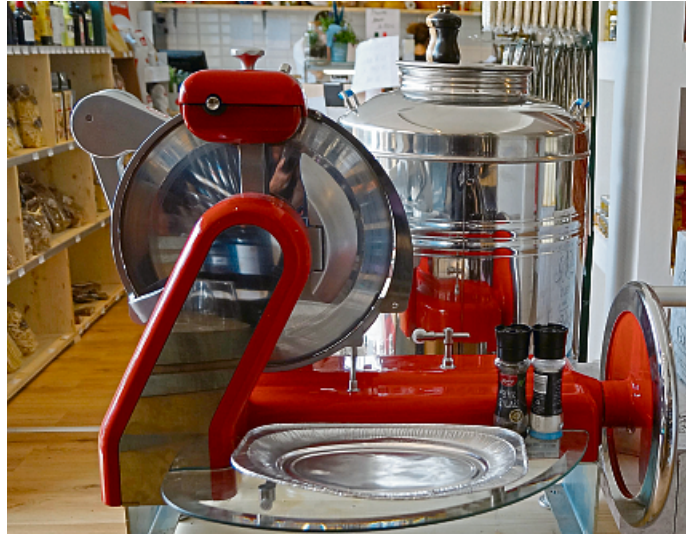
Eingerichtet nach italienischem Vorbild: Im Papa Italia am Rüschausweg 7 in Gievenbeck fühlt man sich wie in Italien.