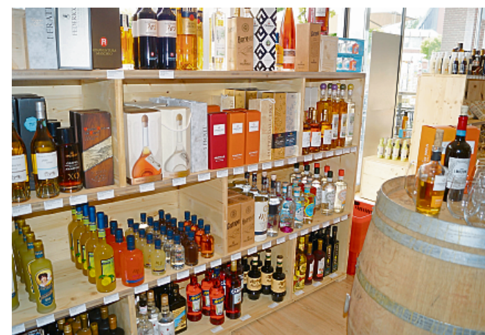
Nach dem Essen ein Grappa gefällig? Kein Problem: Eine große Auswahl verschiedener Sorten bekommt man am Rüschausweg 7.